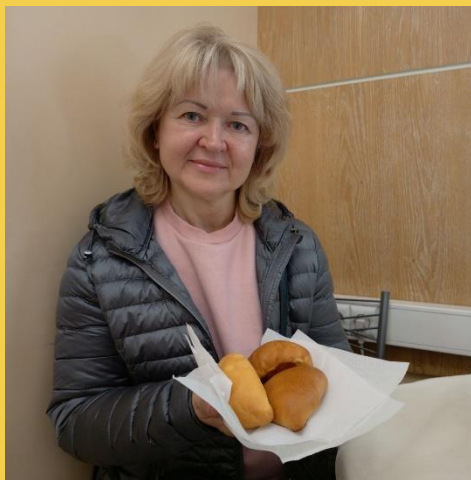
Подопечная в День шарлотки и осенних пирогов.