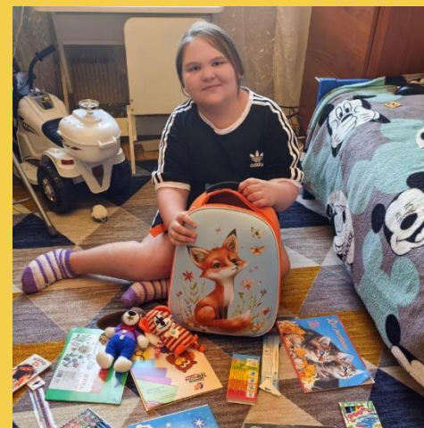
Подопечные получили школьные канцелярский набор.