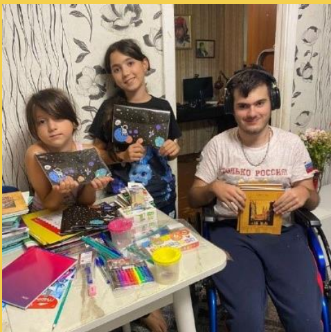
Подопечные получили школьные канцелярский набор.