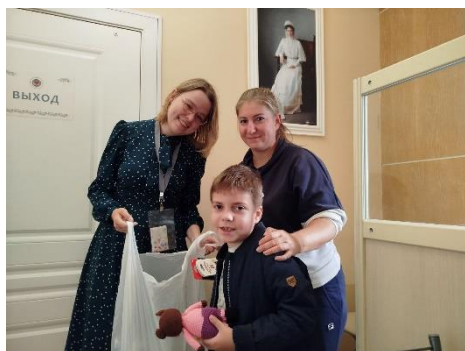
Подопечные получают школьные канцелярский набор.