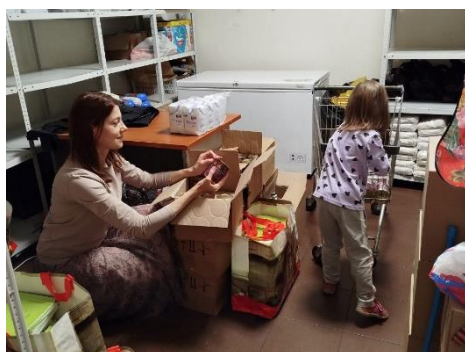
Добровольцы помогают фасовать канцелярские наборы для школьников.